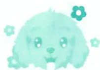
Kék háttér Moji boldog

Moji bilétája jelzi neked, ha Moji éhes, szomjas vagy csak unatkozik és játszani akar. Ha a háttér színe piros, Mojinak igazán szüksége van a figyelmedre.