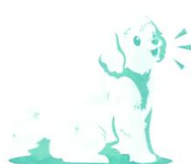
"Moji, Ugat" vagy "Moji, Beszelj egy kicsit"