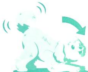
"Moji, Játék" vagy "Moji, Játsszunk"