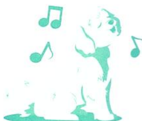
"Moji, Énekelj" vagy "Moji, Most énekelj"