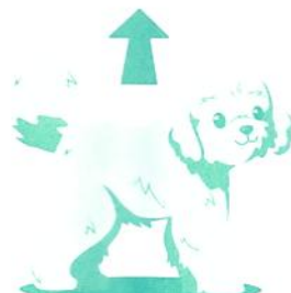
"Moji, Fel" vagy "Moji, Kelj fel"