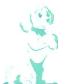
"Moji, Pitizz" vagy "Moji, Pit"