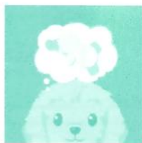
Lila háttér Moji akar valamit